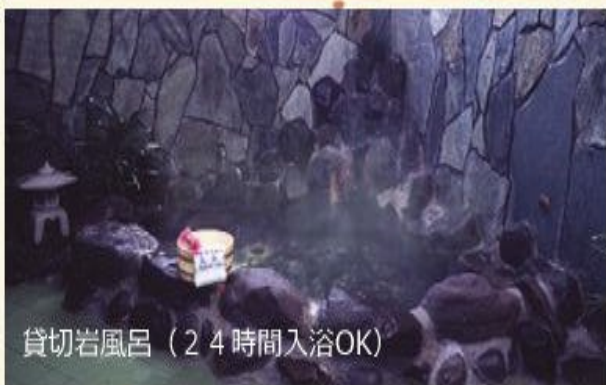
貸切岩風呂 (24時間入浴OK)